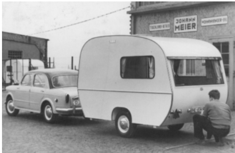
Meiya Hobby - Bj. 1959 - Eigengewicht: 380 kg

Die beiden Teilhaber gehen daher von 1955 an wieder getrennte Wege, wobei Meier den Wohnanhängerbau und den Namen MEIWA beibehält, seine Betriebsstätte jedoch 1956 zum Niedersachsendamm in alte Wehrmachtsgaragen verlegt.