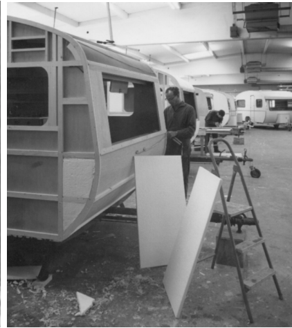
Betriebsgelände in Brinkum-Nord 1971 - Serienfertigung der Modellreihe "Landjacht"